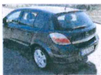
Opel Astra 2600 €