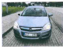
Opel Astra 2450 €