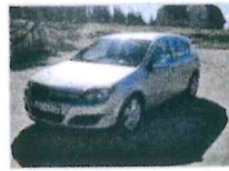
Opel Astra 1650 €