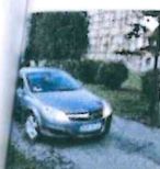
Opel Astra 1750 €